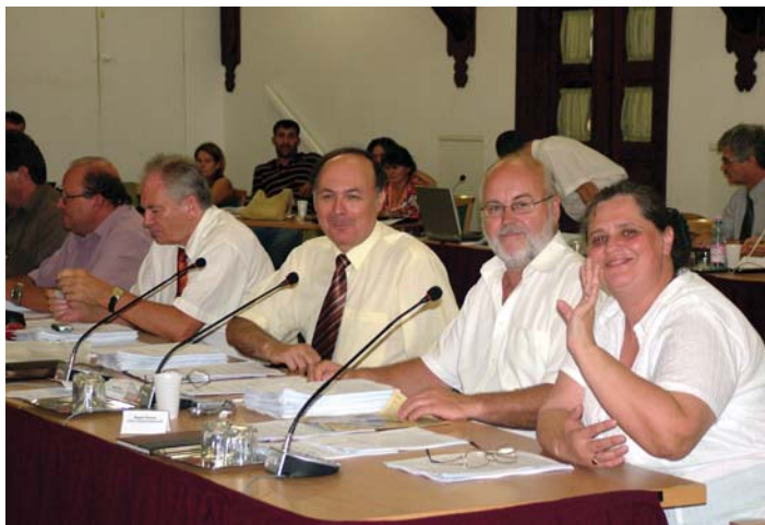
... mások mosolyogva fogadták.

A költségvetés módosításánál szintén vitát váltott ki a polgármes-