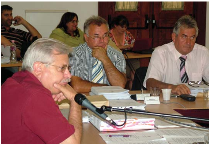
Együtt a Kanizsáért-frakció. Szívügyüknek tekintették az átültetést...

A minősített többség megvolt, ám így is huszonöt perces késéssel kezdte el munkáját a nyári szünet utáni első, szeptember 3-ára összehívott közgyűlés. Ezúttal azonban nem mindenki találta meg a helyét.