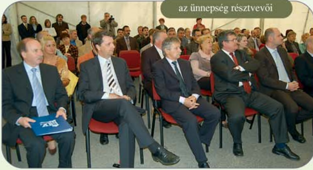
az ünnepség résztvevői

Az ügyfélszolgálat kialakításánál fontos szempont volt a teljes infokommunikációs rendszer, az akadálymentesség, így a mozgássérültek mellett a látás- és hallássérült embertársaink is igénybe tudják venni szolgálta-