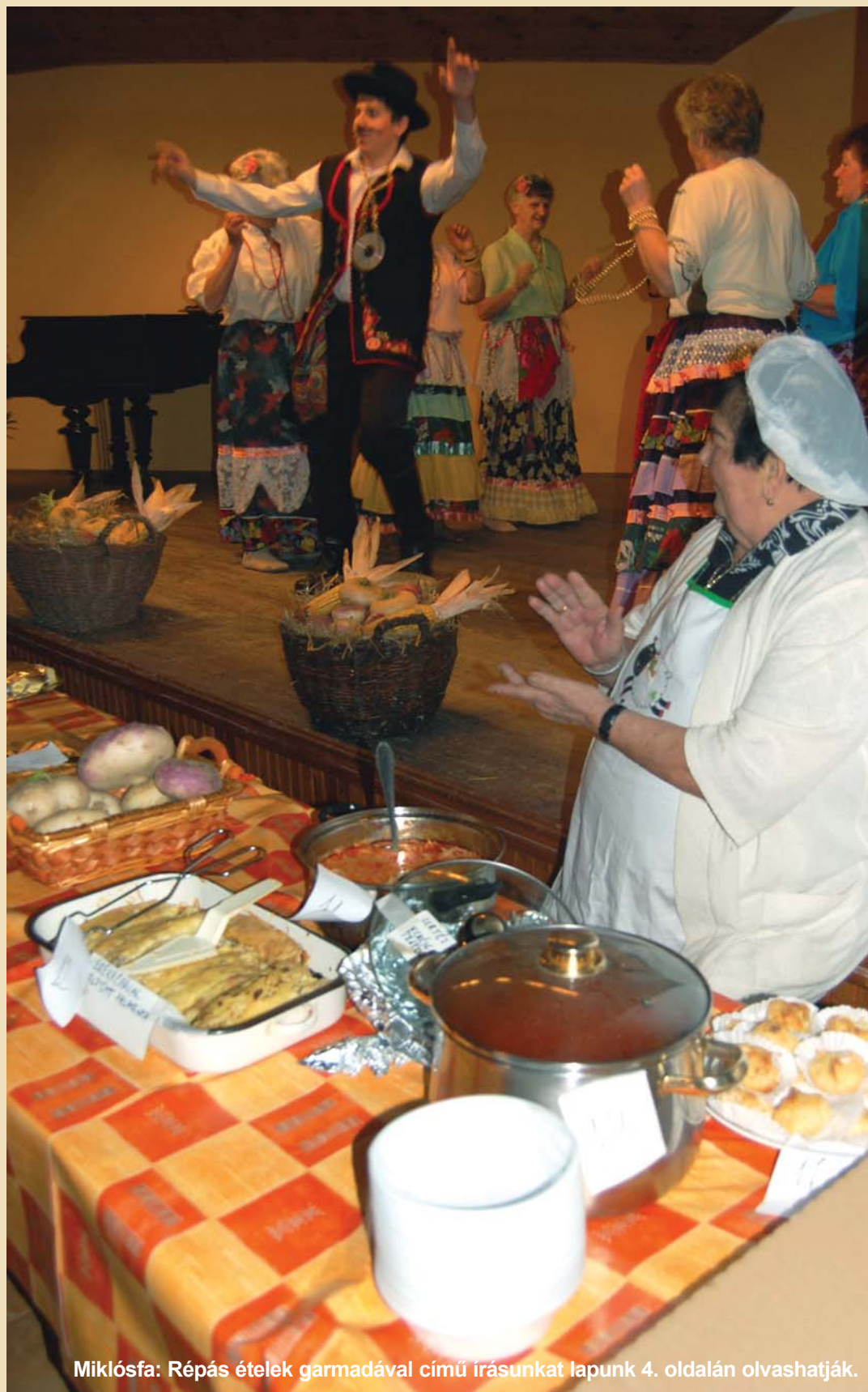
Miklósfa: Répás ételek garmadával című írásunkat lapunk 4. oldalán olvashatják.

XXIII. évfolyam 2. szám 2011. január 20.