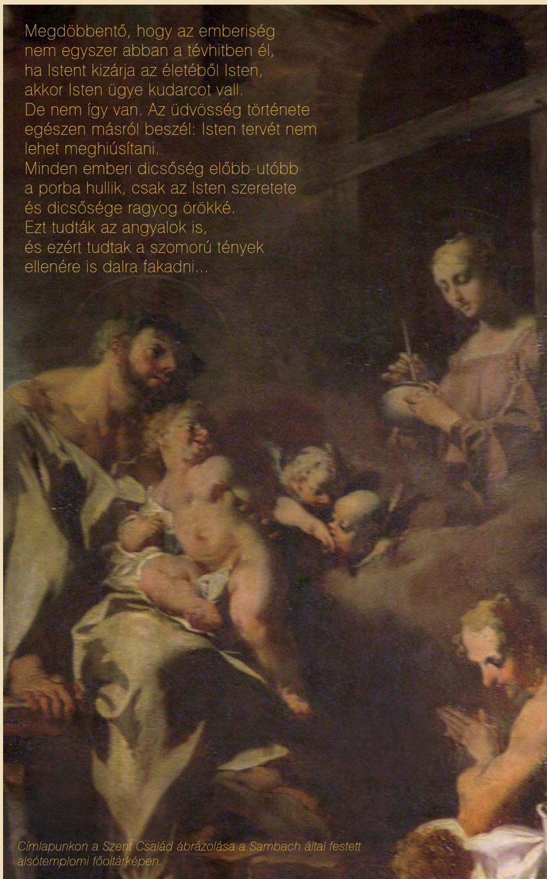
Címlapunkon a Szent Család ábrázolása a Sambach által festett alsótemplomi főoltárképen.